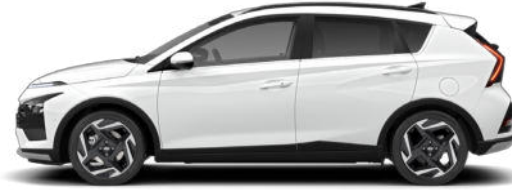
Atlas White Kontrastdach verfügbar