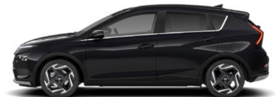
Phantom Black Pearl