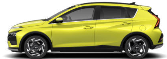
Lucid Lime Metallic Kontrastdach verfügbar