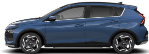
Vibrant Blue Pearl Kontrastdach verfügbar