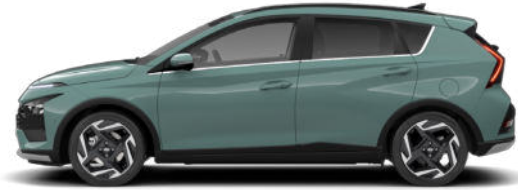
Mangrove Green Pearl Kontrastdach verfügbar