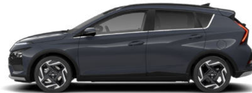
Aurora Gray Pearl