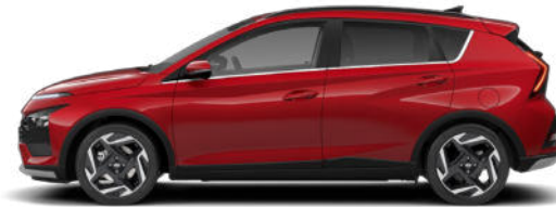
Dragon Red Pearl Kontrastdach verfügbar