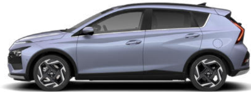
Meta Blue Pearl Kontrastdach verfügbar