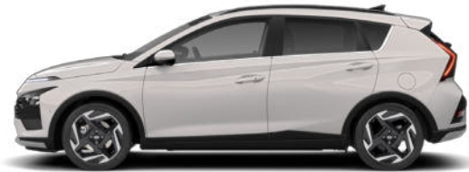
Lumen Gray Pearl Kontrastdach verfügbar